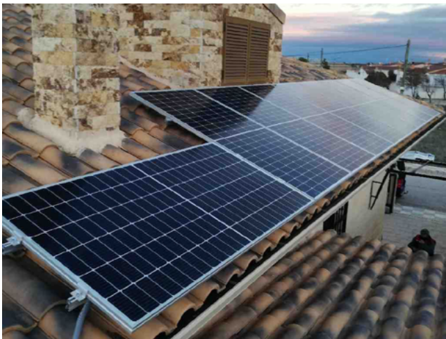
/ Instalación de autoconsumo para la producción de energía para uso doméstico

Utilizando tan solo un inversor Fronius Primo 5.0 , el sistema de 4 kWp ofrece un porcentaje de autoconsumo del 60%. Además, al no utilizar la potencia completa del inversor de 5 kW, dejan un margen para que en un futuro puedan instalar más paneles, si lo desean. Gracias al registro del inversor en la intuitiva plataforma de monitorización, Fronius Solar.web , las incidencias se detectan rápidamente y pueden ser resueltas al momento.