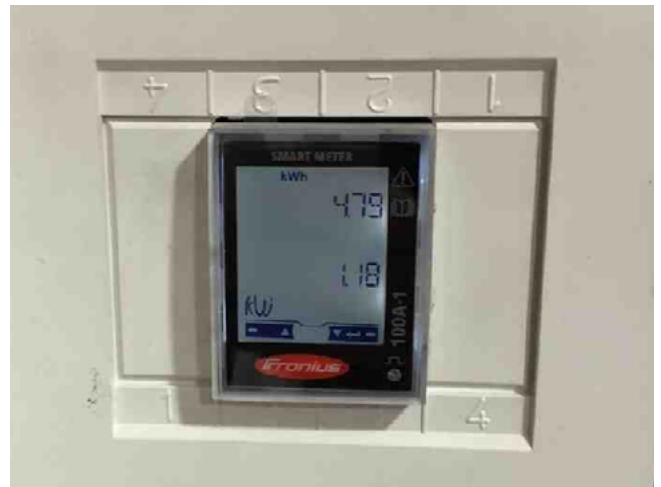
/ Dispositivo para la gestión de energía: Fronius Smart Meter